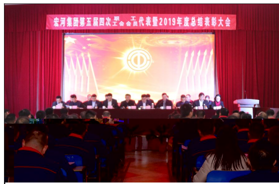
1 a 19日, 宏河集团第五届四次职代会(工代会)暨2019年度总结表彰大会在横河煤矿职工bc召开。